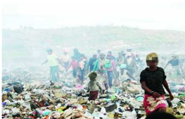
A Madagascar, du chemin reste à faire pour éradiquer la pauvreté

L'Express de Madagascar, quotidien d'information et d'analyse, dans son journal du 11 avril dernier, a publié l'article suivant, intitulé « Selon le PNUD*, Madagascar dans une extrême pauvreté » :