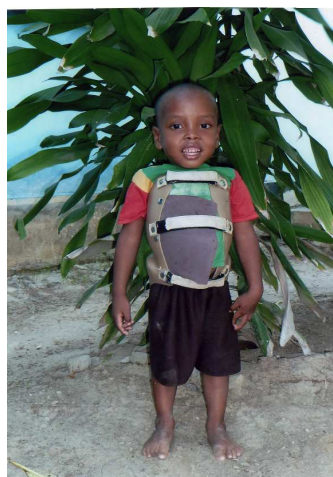
Tojo (mai 2011)