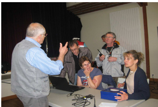
Le Comité des fêtes « Ste Honorine du Fay »

Un grand merci au Président et aux membres du comité des fêtes de Saint Honorine du Fay pour leur grand cœur.