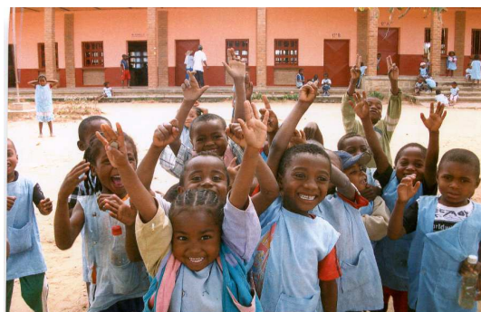
Cour de récréation Ecole de SAKALALINA